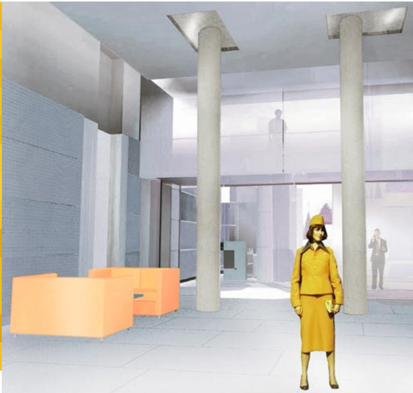
Blick in die Lobby mit Glas-Brücke