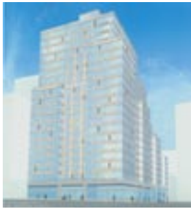
Ansicht des Apartment-Gebäudes vom Broadway

Project-Architect Bauherren- und Fachplaner-Koordination Entwurf/ Ausführungsplanung Fertigstellung des gesamten 370 WE Apartment Gebäudes: 2005